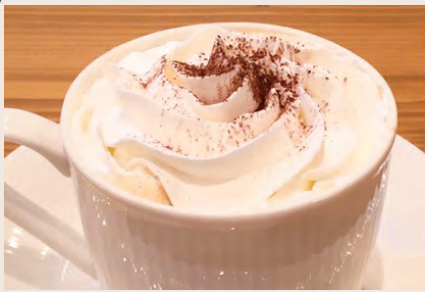
ウィナーコーヒー ¥500 (HOT/ICE)