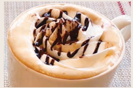
カフェモカ ¥580 (HOT/ICE)

優しい甘みのクリームとキャラメルソースが美味しいドリンク。ナッツのトッピングで食感も楽しい。