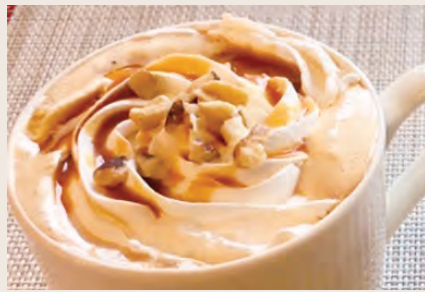
キャラメルラテ ¥580 (HOT/ICE)

優しい甘みのクリームとキャラメルソースが美味しいドリンク。ナッツのトッピングで食感も楽しい。