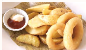
フライドポテト ¥450 (オニオンリング添え) 皮付きポテトとオニオンリングのコンビネーション