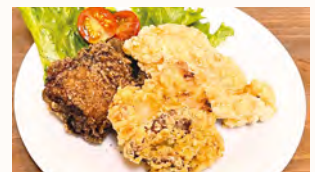
からあげ3種盛り ¥500 花子特製のからあげ3種類が味わえる嬉しい一皿。 (別紙にてから揚げのテイクアウトもご用意しております。)